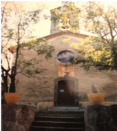
Mas-de-La-Coste, Temple protestant